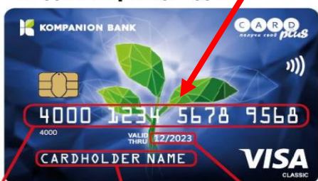
Картанын номери Картанын ээси

Жарактуулук мөөнөтү Акча которуусун алуу үчүн реквизит катары картанын 16 сандуу номерин (картанын бет жагындагы номер) же эсеп номерин жиберүү жетиштүү.